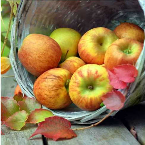
Gul Gråsten, Danmarks Nationalæble