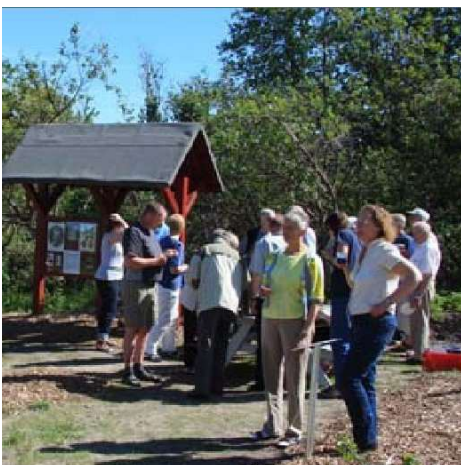
Fra indvielsesfesten i 2009