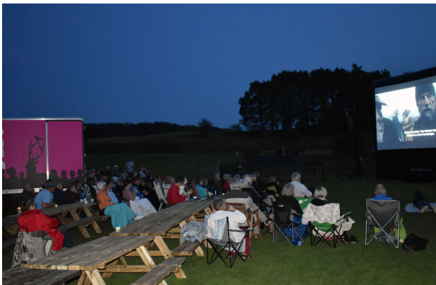
Filmen 'Før Frosten' blev vist for ca. 200 deltagere ved Museumsforeningens 50-års jubilæum i august 2019