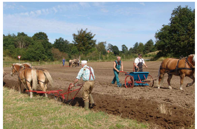
Pløjedag med udstyr som omkring 1920

En helt central del af denne levende formidling er de aktiviteter og arrangementer, som Museumsforeningen står bag. Der bliver presset æblemost, klippet får, tærsket korn, arbejdet med hestespand og gamle traktorer osv. Museet har de seneste år oplevet et stigende besøgstal, og rigtig mange af gæsterne kan henføres til museumsforeningens aktiviteter. Boldrup er på alle måder et levende museum.