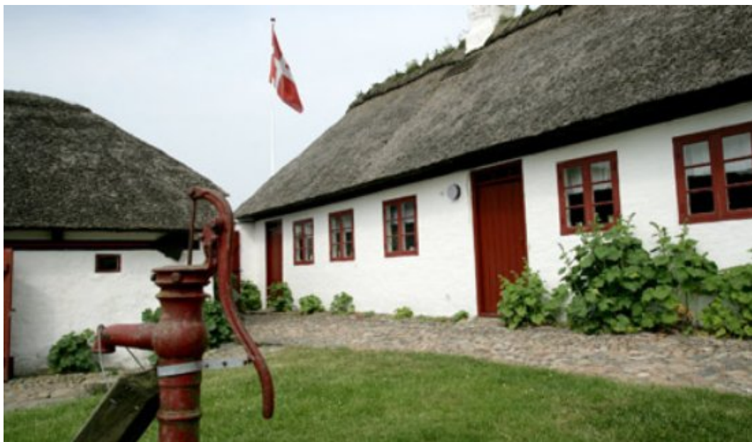
Boldrup Museum og Naturskole